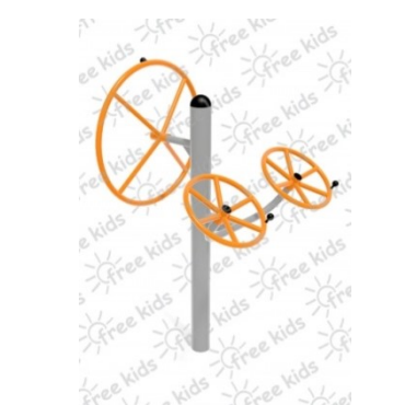
Fot.6 Przykładowe zdjęcie

Konstrukcja nośna oraz pozostałe elementy wykonane z rur stalowych ocynkowanych i malowanych proszkowo. Stopnice wykonane z blachy stalowej ocynkowanej i malowanej proszkowo. Nakrętki kołpakowe ocynkowane zabezpieczone przed odkręceniem, łożyska zamknięte bezobsługowe. Urządzenie powinno być wyposażone w amortyzatory gumowe tłumiące uderzenia. Urządzenie na stałe posadowione w gruncie, betonowane betonem klasy min. B-15.