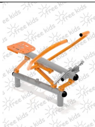
Fot.2 Przykładowe zdjęcie

Konstrukcja nośna oraz pozostałe elementy wykonane z rur stalowych ocynkowanych i malowanych proszkowo. Stopnice wykonane z blachy stalowej ocynkowanej i malowanej proszkowo. Nakrętki kołpakowe ocynkowane zabezpieczone przed odkręceniem, łożyska zamknięte bezobsługowe. Urządzenie powinno być wyposażone w amortyzatory gumowe tłumiące uderzenia. Urządzenie na stałe posadowione w gruncie, betonowane betonem klasy min. B-15.