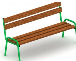
Fot.11 Przykładowe zdjęcie

Urządzenie na stałe posadowione w gruncie, betonowane betonem klasy min. B-15.