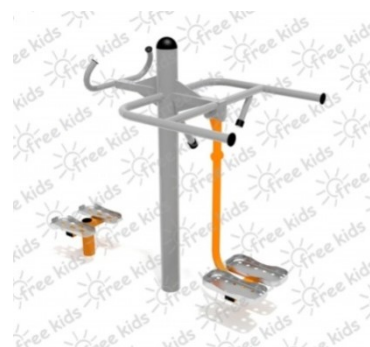
Fot.4 Przykładowe zdjęcie

Konstrukcja nośna oraz pozostałe elementy wykonane z rur stalowych ocynkowanych i malowanych proszkowo. Stopnice wykonane z blachy stalowej ocynkowanej i malowanej proszkowo. Nakrętki kołpakowe ocynkowane zabezpieczone przed odkręceniem, łożyska zamknięte bezobsługowe. Urządzenie powinno być wyposażone w amortyzatory gumowe tłumiące uderzenia