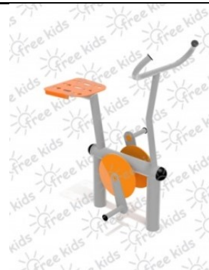
Fot.1 Przykładowe zdjęcie

Konstrukcja nośna oraz pozostałe elementy wykonane z rur stalowych ocynkowanych i malowanych proszkowo. Stopnice wykonane z blachy stalowej ocynkowanej i malowanej proszkowo. Nakrętki kołpakowe ocynkowane zabezpieczone przed odkręceniem, łożyska zamknięte bezobsługowe. Urządzenie powinno być wyposażone w amortyzatory gumowe tłumiące uderzenia.