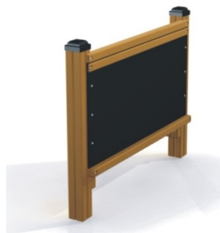
Fot.9 Przykładowe zdjęcie

Dodatki – belki konstrukcyjne osłonięte kapturkami z tworzywa sztucznego. Łby śrub, nakrętki osłonięte plastikowymi zaślepkami. Nakrętki kołpakowe z łbem kulistym.