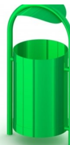
Fot.12 Przykładowe zdjęcie

Kotwienie – urządzenie na stałe posadowione w gruncie, betonowane betonem klasy min. B-15.