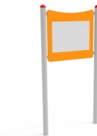
Fot.14 Przykładowe zdjęcie

Kotwienie –urządzenie na stałe posadowione w gruncie, betonowane betonem klasy min. B-15.