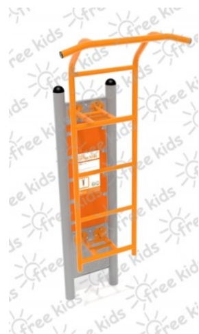
Fot.3 Przykładowe zdjęcie

Konstrukcja nośna oraz pozostałe elementy wykonane z rur stalowych ocynkowanych i malowanych proszkowo. Stopnice wykonane z blachy stalowej ocynkowanej i malowanej proszkowo. Nakrętki kołpakowe ocynkowane zabezpieczone przed odkręceniem, łożyska zamknięte bezobsługowe. Urządzenie powinno być wyposażone w amortyzatory gumowe tłumiące uderzenia. Urządzenie na stałe posadowione w gruncie, betonowane betonem klasy min. B-15.