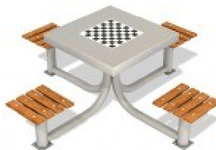
Fot.8 Przykładowe zdjęcie

Dodatki – belki konstrukcyjne osłonięte kapturkami z tworzywa sztucznego. Łby śrub, nakrętki osłonięte plastikowymi zaślepkami. Nakrętki kołpakowe z łbem kulistym.