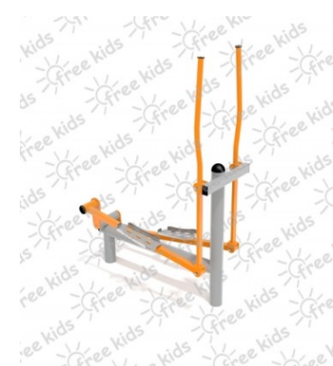
Fot.5 Przykładowe zdjęcie

ocynkowanych i malowanych proszkowo. Stopnice wykonane z blachy stalowej ocynkowanej i malowanej proszkowo. Nakrętki kołpakowe ocynkowane zabezpieczone przed odkręceniem, łożyska zamknięte bezobsługowe. Urządzenie powinno być wyposażone w amortyzatory gumowe tłumiące uderzenia.